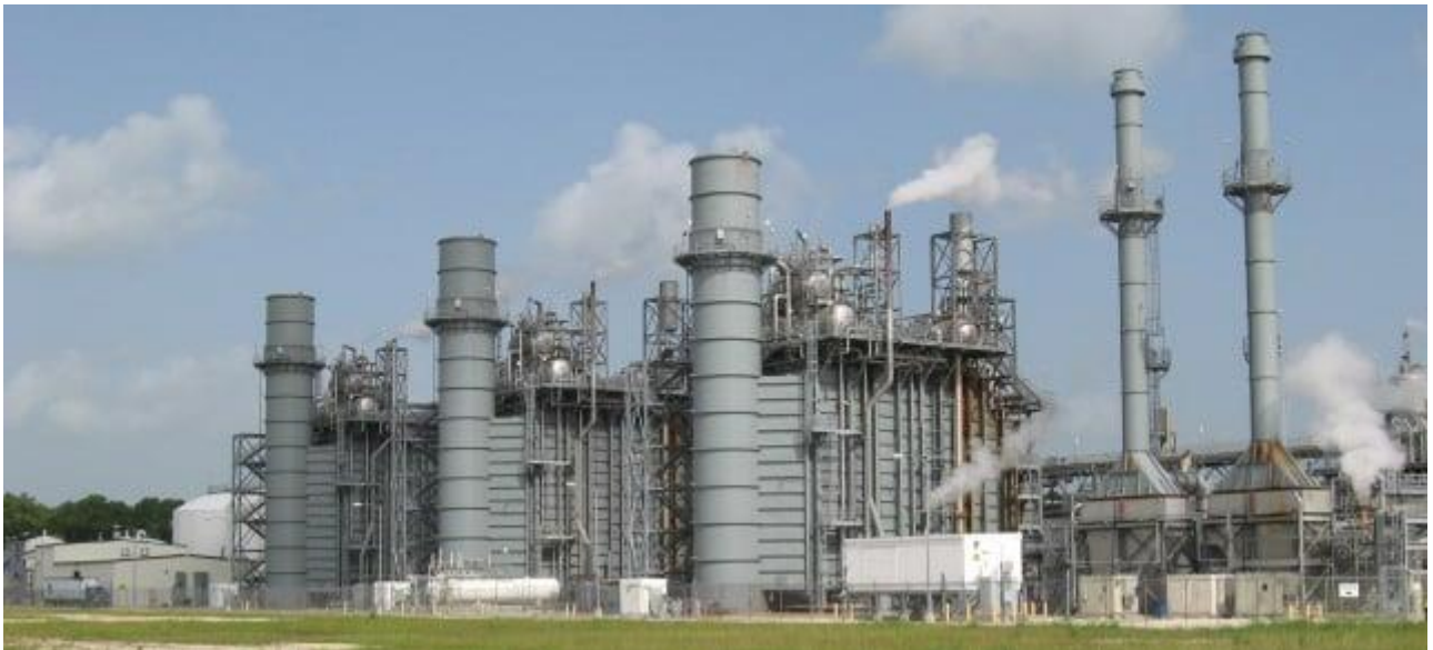
Енергетичний центр у місті Бейтауні